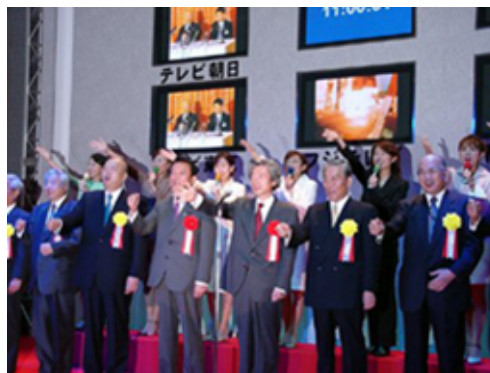
地上デジタルテレビ放送の幕開けに向けたカウントダウンと放送開始の瞬間

この日「地上デジタル推進全国会議」および「全国地上デジタル放送推進協議会」「(社)地上デジタル放送推進協会」3団体の主催による“地上デジタル放送開始記念式典”が開催された。また同時に“地上デジタル推進全国会議第2回総会”が開催されたこともあって、各界のリーダーおよそ900人の方々が参加、テレビ、新聞、雑誌などのプレスも200人を超える盛況ぶりであった。